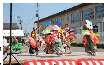
昨年度の「きたうら祭り」