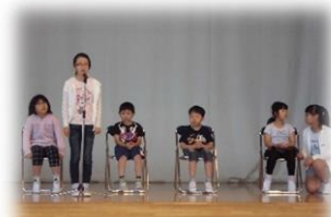
歯科講話のお礼の挨拶・プール開きで水泳の目標発表をする6年生