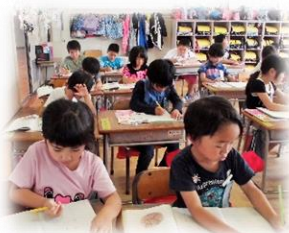
国語の読取後、感想を書く1年生

6月は、各学級で集中して授業に取り組む学習習慣・意欲をもたせる授業づくりを目指しました。今年は、国語科を中心に「子どもの思いや理解したことを書き表す力を伸ばすこと」に力を入れていきます。また、大勢の前でも大きな声で話すことができること、はっきりと意見や感想を伝えることができるように普段から頑張っています。